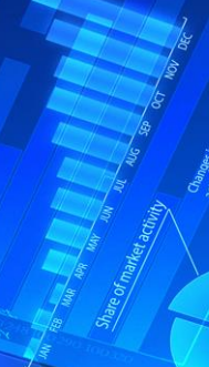
Share of market activity