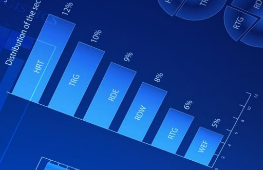
Distribution of the securities market key players